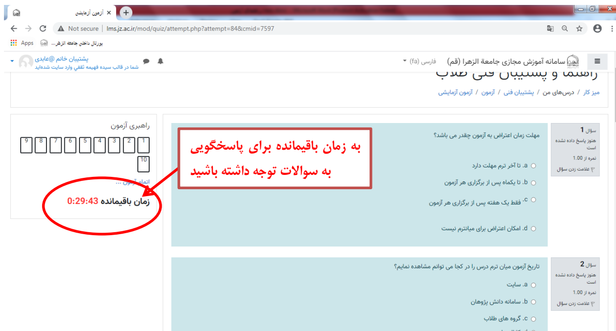
تصویر شماره ۵- نمایش صفحه آزمون و امکان پاسخگویی به سوالات تستی

پس از شروع آزمون، سوالات تستی را مشاهده خواهید کرد و باید از لحظه‌ای که سوالات در سیستم شما نمایش داده می‌شوند در زمان مشخصی (مدت پاسخگویی در این آزمون حداکثر ۳۰ دقیقه می‌باشد) به سوالات پاسخ دهید. زمان باقیمانده برای پاسخگویی به سوالات در تصویر شماره ۵ نمایش داده شده است.