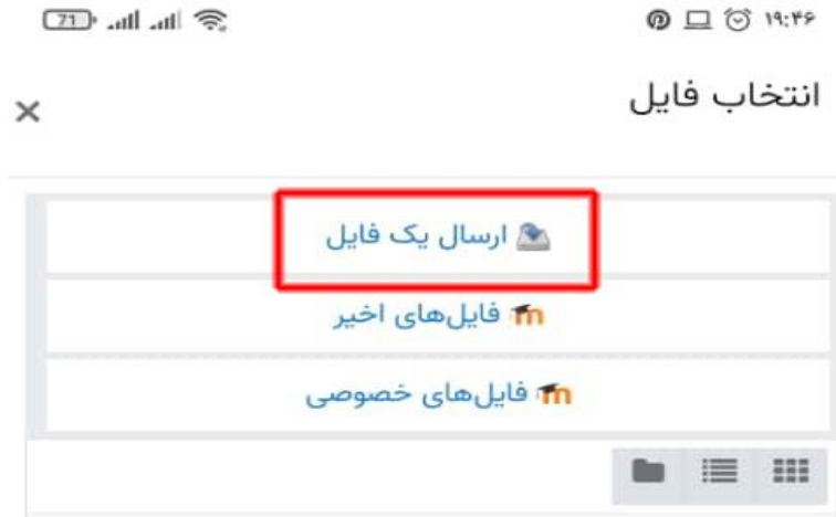
تصویر شماره 7- مرحله 2 ارسال پاسخ نامه در گوشی موبایل