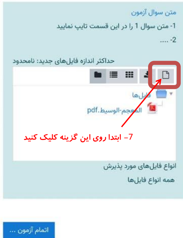
تصویر شماره 10- آغاز ارسال فایل دوم پاسخنامه

برای بارگذاری صفحات بعدی پاسخنامه خود مجدد روی گزینه نمایش داده شده در تصویر زیر کلیک کنید و همانند قبل فایل عکس خود را بارگذاری کنید.