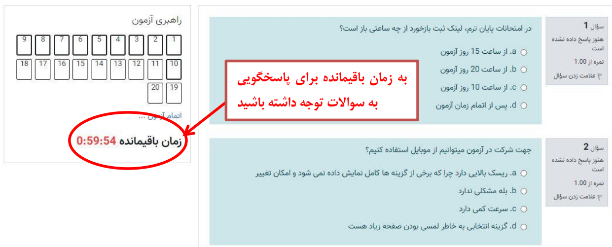
تصویر شماره ۵- نمایش صفحه آزمون و امکان پاسخگویی به سوالات تستی

پس از شروع آزمون، سوالات تستی را مشاهده خواهید کرد و باید از لحظه‌ای که سوالات در سیستم شما نمایش داده می‌شوند در زمان باقیمانده به سوالات پاسخ دهید. زمان باقیمانده برای پاسخگویی به سوالات در تصویر شماره ۵ نمایش داده شده است.