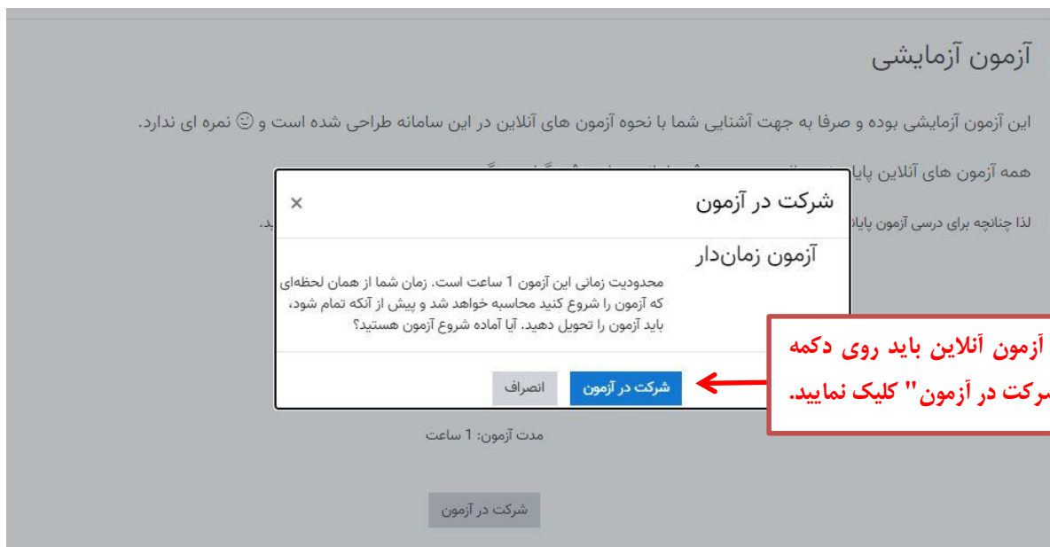
تصویر شماره ۴- نمایش پنجره تأیید برای شروع اجرای آزمون آنلاین

پس از شروع آزمون، سوالات تستی را مشاهده خواهید کرد و باید از لحظه‌ای که سوالات در سیستم شما نمایش داده می‌شوند در زمان باقیمانده به سوالات پاسخ دهید. زمان باقیمانده برای پاسخگویی به سوالات در تصویر شماره ۵ نمایش داده شده است.