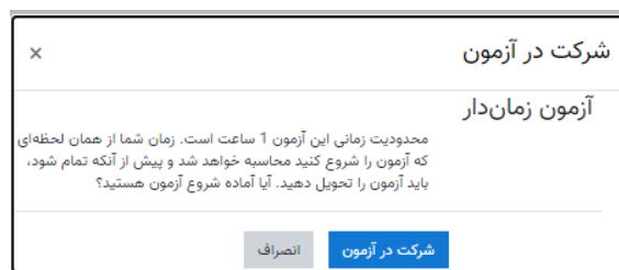
تصویر شماره 3- پنجره شروع آزمون

برای شروع پاسخگویی به سؤالات روی دکمه "شرکت در آزمون" کلیک کنید، پس از آن یک پنجره هشدار برای شما نمایان می‌شود که برای ادامه باید روی دکمه "شرکت در آزمون" کلیک نمایید. به تصویر شماره 3 دقت فرمایید.